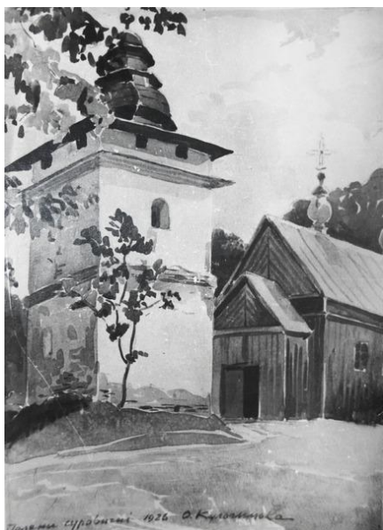
Tak wyglądała w roku 1926