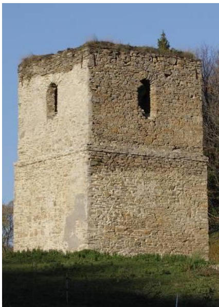
Tak wygląda dziś