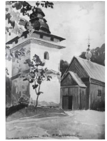
Stan 90 lat temu...