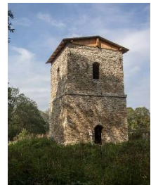
Stan 2 lata temu