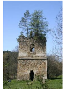
Stan 10 lat temu...